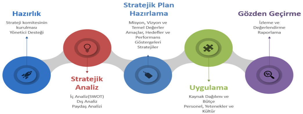
Tablo 2 Stratejik Planlama Döngüsü